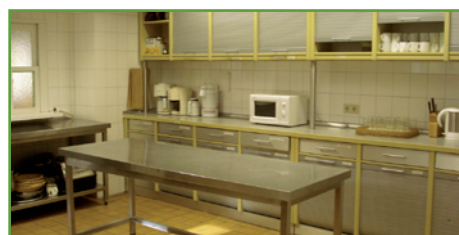
Voll ausgestattete Küche zur Versorgung kleinerer sowie großer Gruppen